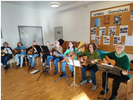
Gitarrenkreis im Gemeindefestsaal