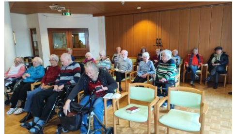
Andacht im Pflegeheim