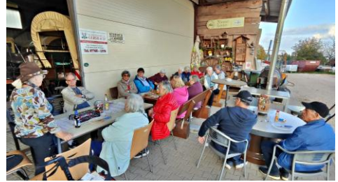
Imbiss auf dem Behringerhof