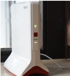
Sorgt für WLAN im Gemeindesaal