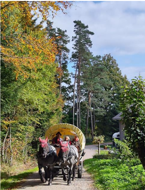
Kutschfahrt beim Ausflug zum Behringerhof

Der Frauenkreis blickt auf ein bewegtes Jahr zurück. Neben schönen Momenten musste der Kreis auch von einigen langjährigen Mitgliedern Abschied nehmen. Doch die gemeinsamen Stunden bleiben lebendig: Spielenachmittage, Ausflüge an den Bergsee oder zum Behringer Hof, eine Hitparade mit echten Schallplatten sowie abwechslungsreiche Themenrunden sorgten für viele besondere Erinnerungen. Für jeden Geschmack war etwas dabei.