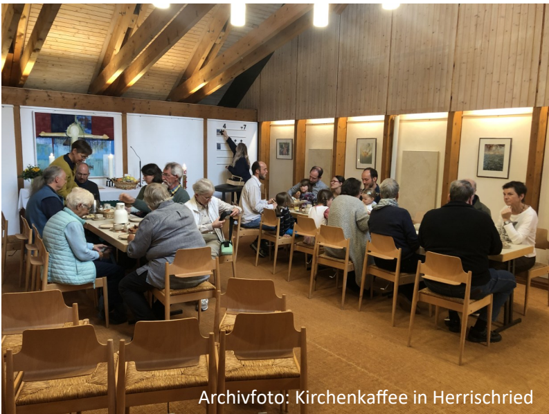
Archivfoto: Kirchenkaffee in Herrischried